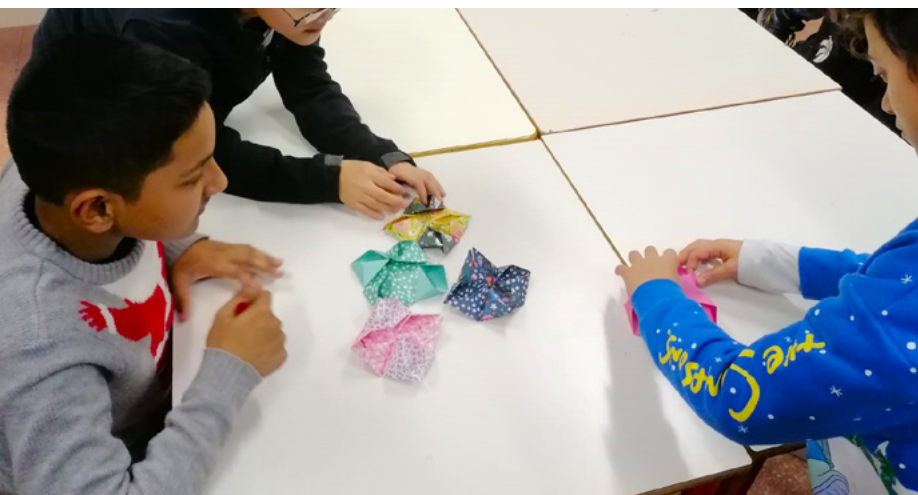
Visita Cascina Nascosta