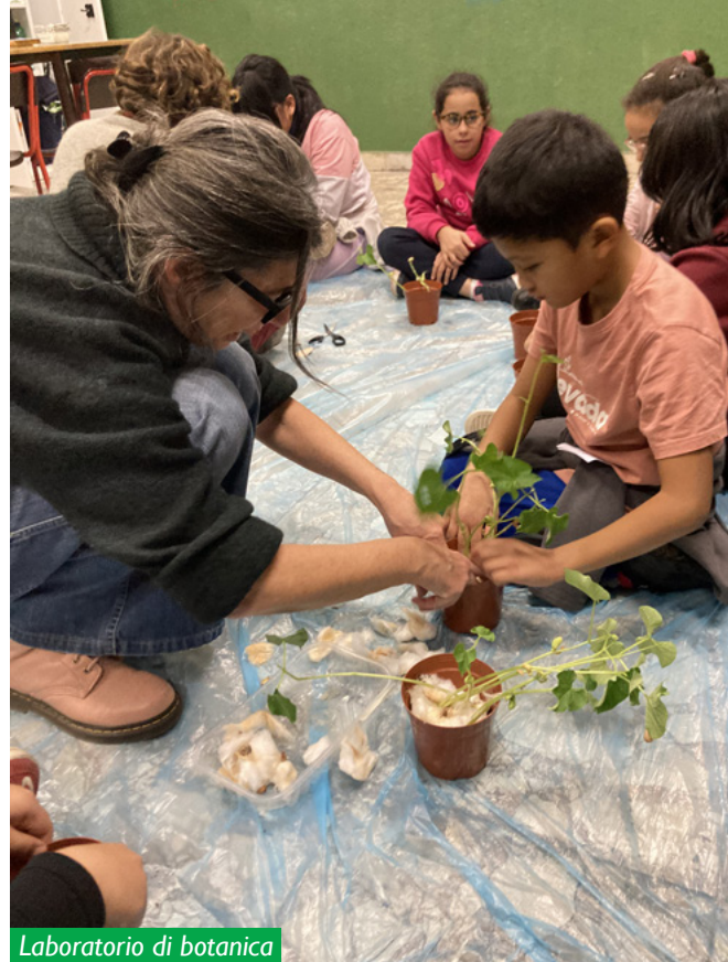
Laboratorio di botanica