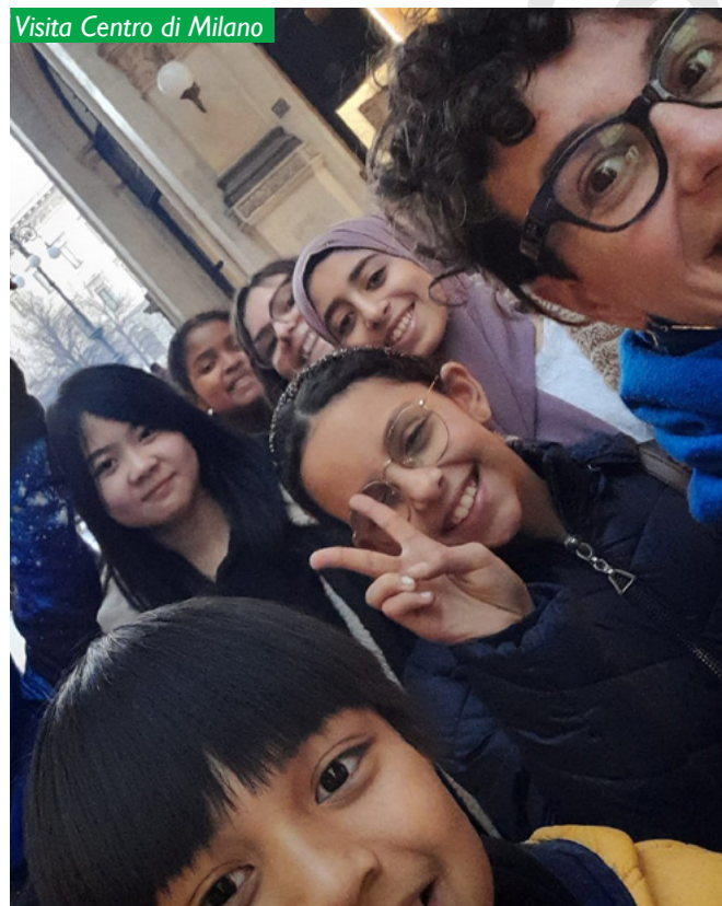
Visita Centro di Milano