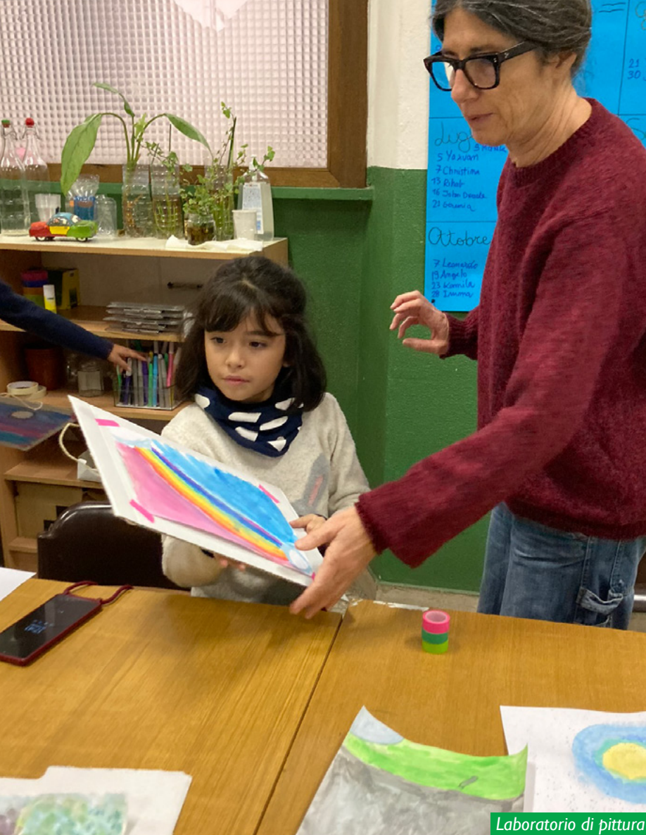
Laboratorio di pittura