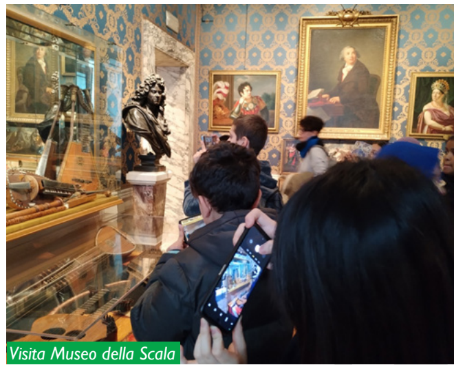
Visita Museo della Scala